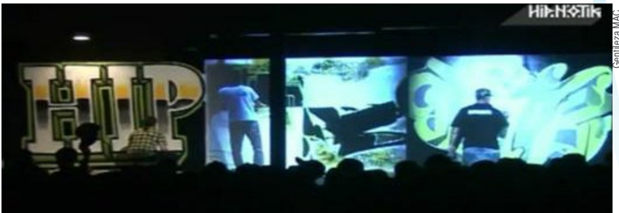
Foros y conferencias en red, interacción de exposiciones, performances y muestras escénicas compartidas podrían formar parte del calendario de Anilla Cultural 2011.

(Brasil) y el Museo de Antioquia en Medellín (Colombia). Además, en Cataluña, España también participan el Gran Teatre del Liceu de Barcelona, el Mercat de les Flors (Centro Nacional de las Artes del Movimiento), la Xarxa Transversal (red cultural de municipios de Cataluña) y el laboratorio ciudadano digital Citilab, los cuales junto al CCCB y a i2Cat dieron vida en 2007 a lo que se conoce como Anilla Catalana, precedente de la experiencia que se está impulsando ahora entre Europa y Latinoamérica. El proyecto es cofinanciado por la Agencia Española de Cooperación Internacional (AECID), y cuenta con la colaboración de RedIRIS y RedCLARA, mediante RNP de Brasil, REUNA de Chile y RENATA de Colombia.